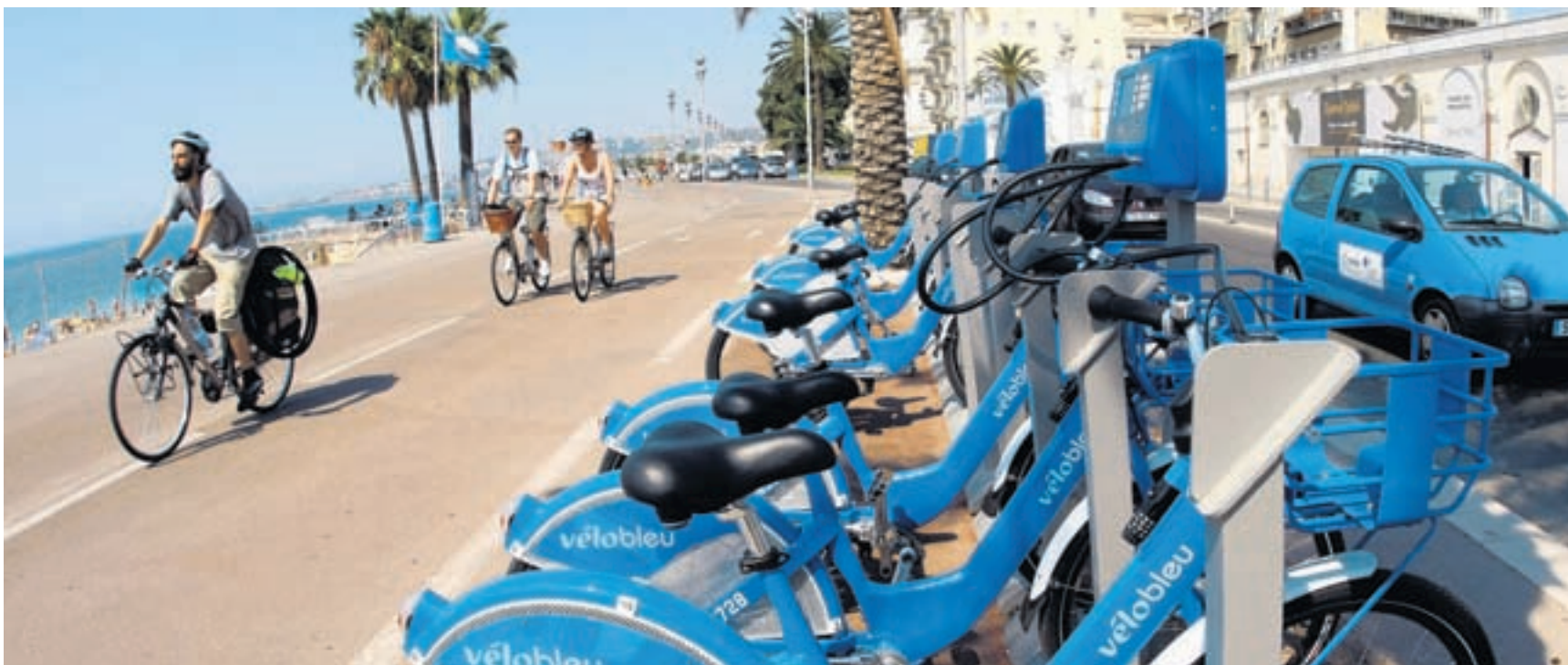
Verleihstation. Wie hier in Nizza sollen in Basel dereinst Leihvelos zur Verfügung stehen – es gibt jedoch auch skeptische Stimmen.

Stadt, Universität und Jungliberale möchten einen elektronischen Verleih